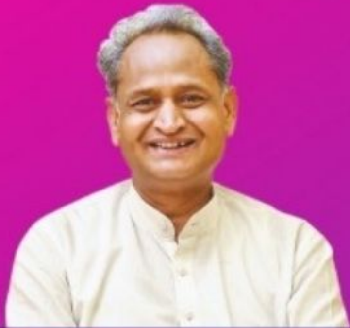
अशोक गहलोत मुख्यमंत्री, राजस्थान